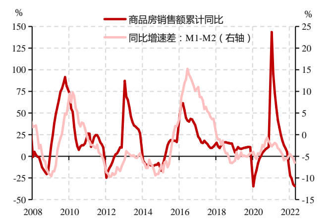
图表 3. 地产修复偏慢，货币活化受限