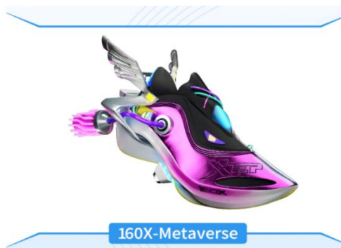
图2: 特步 160X-Metaverse 数字藏品