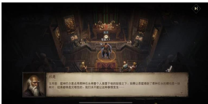
图 2：《暗黑破坏神：不朽》游戏截图