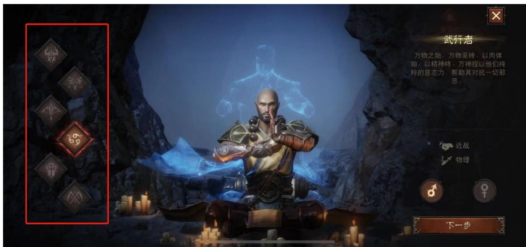
图 1：《暗黑破坏神：不朽》六大职业选择

充分继承暗黑破坏神 IP 内核，实现传统与创新的平衡。《暗黑破坏神：不朽》的剧情承接 2 代和 3 代，其六大职业保留了《暗黑 2》、《暗黑 3》职业系统的经典与核心部分，同时还对不同职业不同形式的独特战斗体验以及场景设计上进行充分还原。此外，《暗黑破坏神：不朽》在视听维度具有优秀的表现力，进一步夯实暗黑系列的底层基础。虽然《暗黑破坏神：不朽》诸多玩法体系都有一定程度的精简，降低操作的门槛，但其整体的操作体验和表现力在手机仍然优秀，且它在有限的条件下，尽可能还原了暗黑系列的战斗风格与打击感。同时《暗黑破坏神：不朽》提供大型多人在线体验（MMORPG），玩家可以在枢纽城市和其他玩家聚会，查看他们的装备，和其他玩家进行互动。总体而言，《暗黑破坏神：不朽》整体借一种更加线性的养成体验和碎片式的战斗乐趣来源，既可以让老玩家感受到“暗黑系列游戏”的纯正乐趣，也降低大众手游玩家的上手门槛，提升了大部分用户的游戏体验。