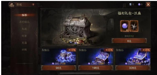
图 4:《暗黑破坏神：不朽》的商城截图

氪金引争议，暴雪回应“以出色的玩法为主”。自《暗黑破坏神：不朽》上线后，游戏内的氪金系统引起较大争议。对此，暴雪总裁回应称，公司在考虑货币化时，最优先的讨论事项是如何为数亿玩家提供免费的《暗黑破坏神》体验，让他们可以在游戏中获得 99.5% 的内容体验，而且绝大多数玩家并没有在这款游戏中花钱。