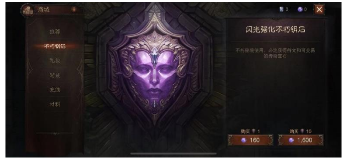
图 5:《暗黑破坏神：不朽》的商城截图