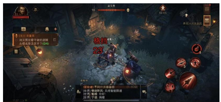
图 3：《暗黑破坏神：不朽》游戏截图