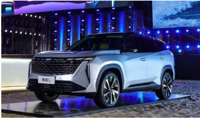
图 1 博越 L 外观