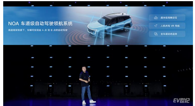
图 2 博越 L NOA 车道级自动驾驶领航系统