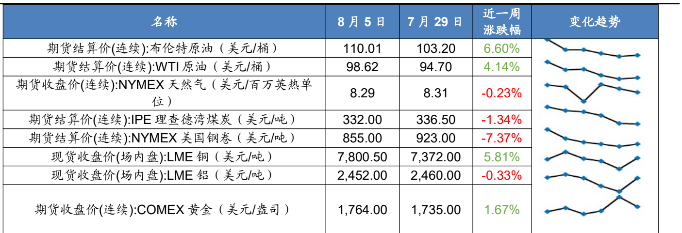
图表 8 2022 年 8 月第 1 周海外资产价格一览