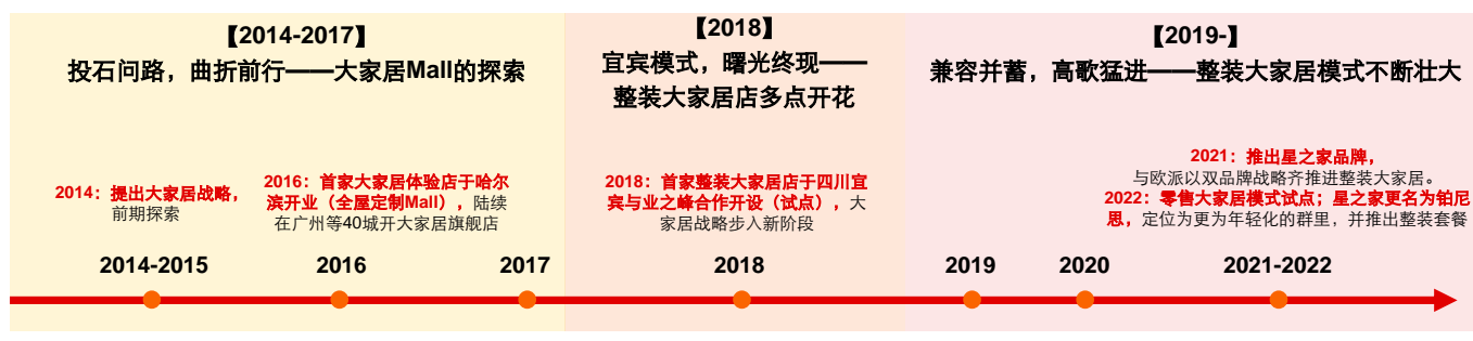
图 2：公司大家居模式的演绎历程