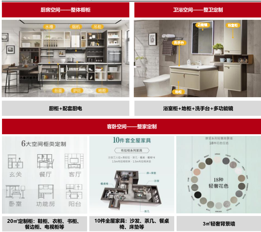
图 3：欧派“大家居”业务模式布局