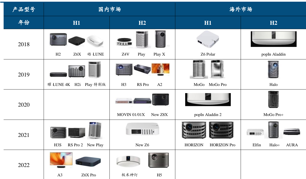
图表 1：公司国内和海外市场产品矩阵布局完善，迭代周期和推新节奏稳定