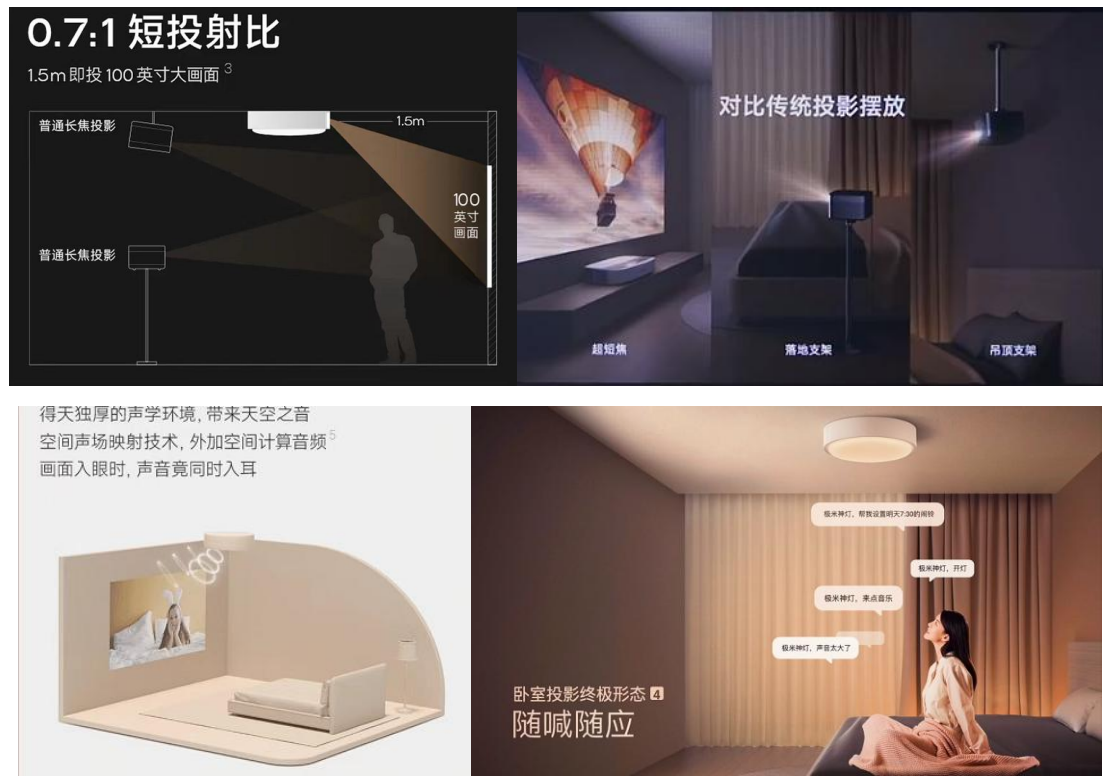
图 4：极米神灯探索卧室投影终极形态

极米神灯创新国内智能投影产品形态，具有差异化产品优势。极米神灯采用自研短焦光机，亮度提升 30%+，具体来看，其具有防射眼、不占地、声音体验好、随时在线等优势。