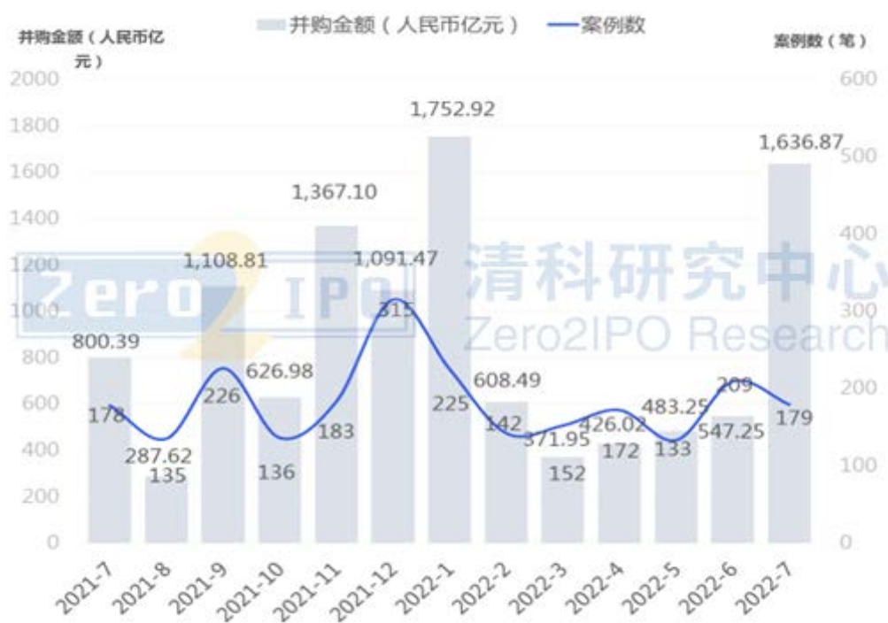
图 1 2021年7月至2022年7月并购市场交易趋势图

根据清科创业(1945.HK)旗下清科研究中心数据,2022年7月中国并购市场共完成179笔并购交易,数量环比下降14.4%,同比上升46.7%。其中披露金额的有142笔,交易总金额约为1636.87亿人民币,环比上升199.1%,同比上升104.5%。