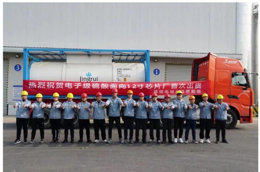
图表 2 晶瑞电材半导体高纯电子硫酸面向 12 寸芯片厂批量出货

在半导体高纯湿电子化学品方面，公司已跻身国际最先进水平，成为全球范围内同时掌握半导体高纯硫酸、半导体高纯双氧水、半导体高纯氨水三项技术的少数几家企业之一，三项产品整体达到了最高纯度 SEMI G5 等级，为半导体关键材料国产化，打造高端半导体产业链供应链提供了强有力的支撑。