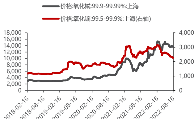
图4: 氧化镝、氧化铽价格 (元/千克)