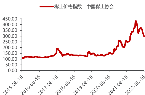
图3: 稀土价格指数 (点)

稀土根据用量大小可划分为重稀土氧化镝、重稀土氧化铽和轻稀土氧化镨钕三大稀土。 重稀土氧化镝及氧化铽主要运用于钕铁硼材料的添加剂，钕铁硼材料广泛应用于新能源汽车、智能机器人、变频空调等领域。近年来受钕铁硼磁性材料需求的拉动，重稀土价格相应走高，今年以来价格虽略有下跌，但仍维持高位。随着智能化时代到来，新能源汽车、5G 智能手机、智能机器人、智能家电等不断推广普及，未来对中重稀土的需求增速会进一步提升，对于此次探勘发现丰富的中重稀土资源的赤峰黄金来说，在中重稀土战略价值日益凸显之下，公司未来收益可期。