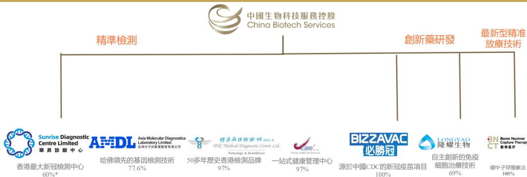
图 1: 公司业务布局

*上市公司于昇昇检测中心拥有40%實際權益，连同其他持有20%實際權益的一致行動人股東，上市公司被視為擁有昇昇检测中心60%的控制性權益。