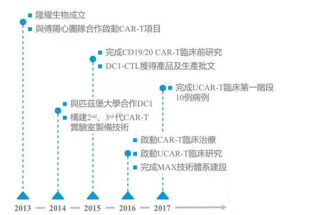
图 4: 上海隆耀生物研发进展