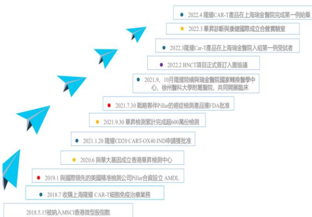
图 2: 公司历史与发展里程碑