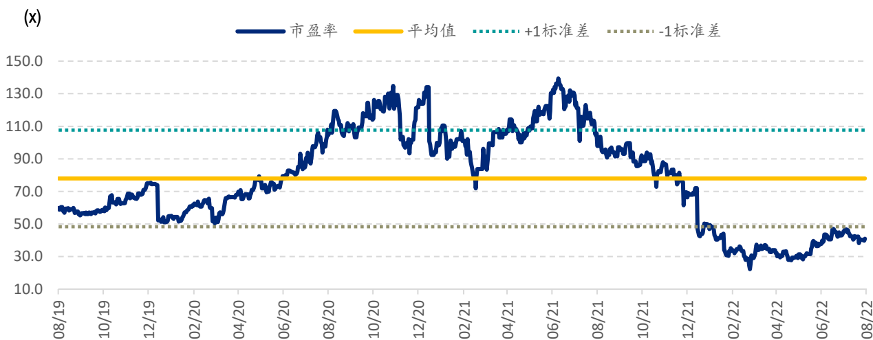
图表 3: 药明生物 PE Band