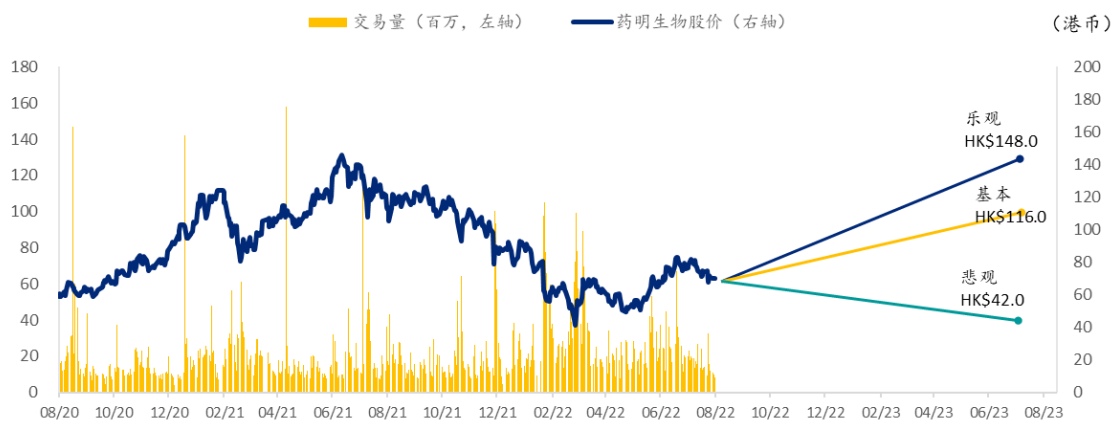
图表 7: 药明生物 SPDBI 情景假设