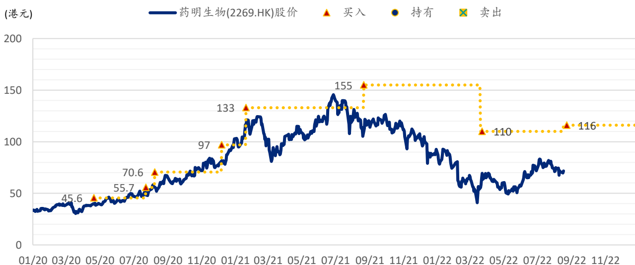
图表 4: 浦银国际目标价: 药明生物