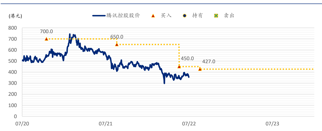
图表 4: SPDBI 目标价: 腾讯