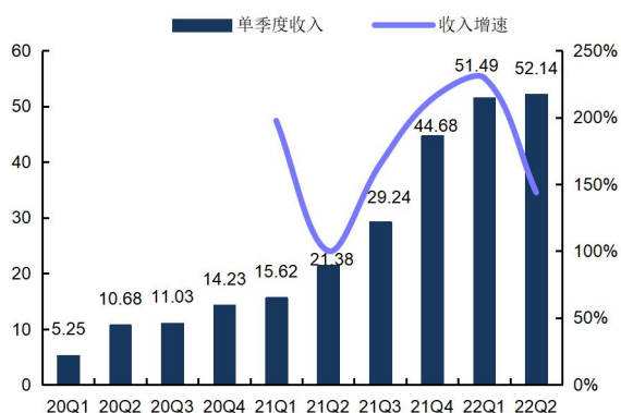
图1: 天赐材料单季度营业收入及增速(单位: 亿元、%)

公司 2022 年 H1 实现营收 103.63 亿元,同比增长 180.13%,实现归母净利润 29.06 亿元,同比增长 271.32%;2022 年 H1 公司毛利率为 43.04%,净利率为 28.72%;对应 2022Q2 公司实现营收 52.14 亿,环比+1.7%,实现归母净利润 14.08 亿,环比-6%,毛利率 42.06%,环比-1.98pct,净利率 27.76%。盈利能力保持高位,我们估计 Q2 电解液出货 6.2 万吨,单吨净利 1.6-1.7 万元,公司基本实现六氟自供,一体化布局加深公司盈利水平。展望 2022 全年,预计公司出货 32 万吨以上,全年单吨净利 1.5 万元,预计 2023 年公司出货 50 万吨以上。