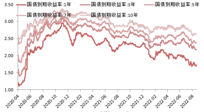
图 2:国债收益率曲线和每日变动