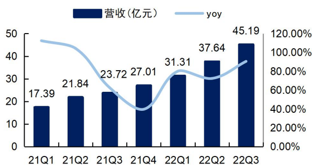
图2：璞泰来单季度营业收入及增速（单位：亿元、%）