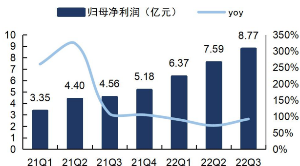
图3：璞泰来单季度归母净利润及增速（单位：亿元、%）