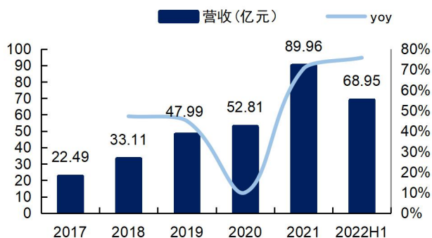
图1：璞泰来营业收入及增速（单位：亿元、%）

2022 年前三季度公司实现营收 114.14 亿，同增 81.31%；实现归母净利润 22.73 亿，同增 84.68%，毛利率 36.38%，净利率 21.45%；对应 2022Q3 营收 45.19 亿，环增 20.04%，归母净利润 8.77 亿，环增 15.59%，Q3 毛利率 34.75%，环比下降 1.64pct，净利率 20.69%，环比下降 1.23pct。