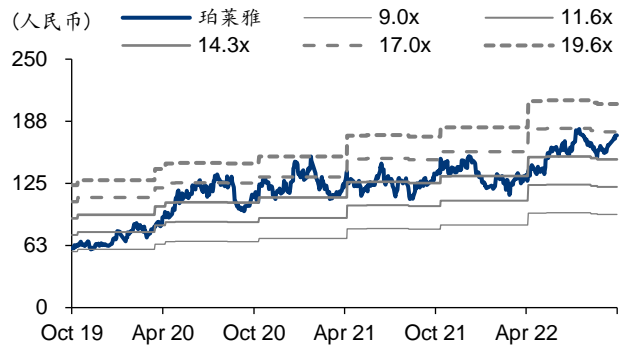
图表3: 珀莱雅 PB-Bands