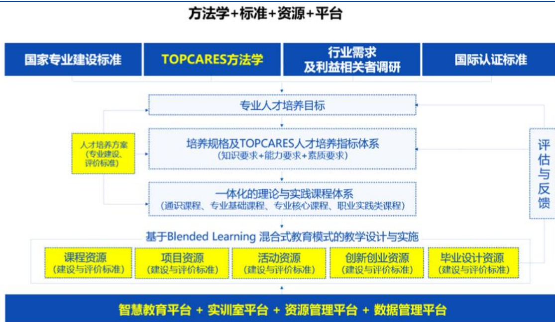
图表 1: 东软教育教育资源输出业务体系

公司教育资源输出业务先发优势强，合作范围广。东软教育科集团 22 年来致力于数字化人才教育服务，依托东软雄厚的产业优势与学历教育丰富的办学积淀，将三所大学经过实践验证的先进教育理念、方法、模式、体系、标准等数字化、产品化、平台化，并在三所大学持续应用、反馈与迭代升级基础上，以专业共建与产业学院、智慧教育平台与教学内容、实验实训室解决方案等形式，并通过开放式产教融合基地——东软数字工场，以 O2O (Offline to Online)、轻资产、少人力的“3+N”商业模式，向众多本科院校和职业院校输出一流的教育产品与服务，为合作院校教育改革创新赋能。目前已经应用于 400 余家院校，包括有 31 所中国“双一流”建设高校和 64 所中国职业教育“双高计划”建设学校。