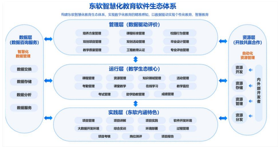
图表 5: 东软智慧化教育软件生态系统