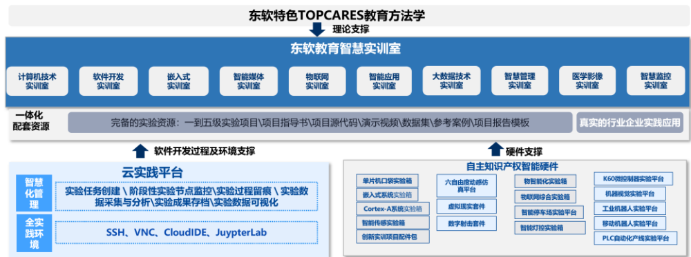
图表 2: 东软教育智慧实训室解决方案