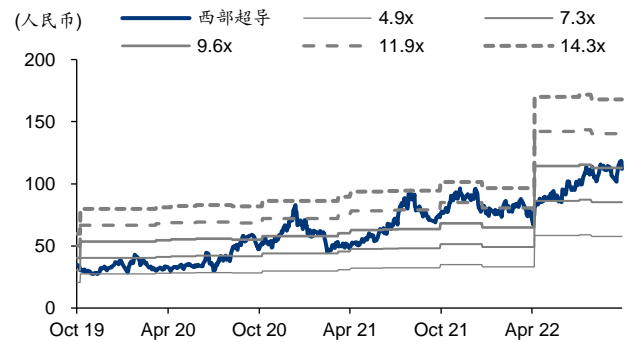
图表3: 西部超导 PB-Bands