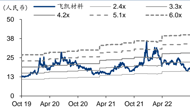
图表3: 飞凯材料 PB-Bands