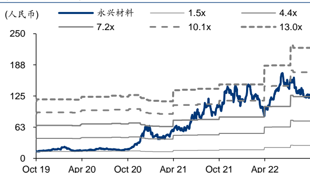
图表4: 永兴材料 PB-Bands