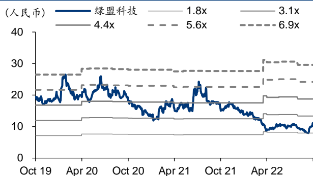
图表3: 绿盟科技 PB-Bands