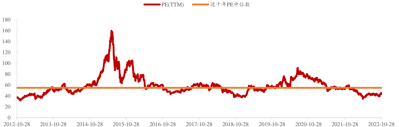
图表3. 计算机指数(申万)近10年PE(TTM)

当前计算机板块整体估值处于历史较低水平。截至2022年10月28日,计算机板块市盈率-TTM为44.40,历史中位数为54.81,分位点处于近十年的17.80%。计算机指数(申万)过去10年市盈率-TTM低点为29.48,发生于2012年7月;历史高点为159.70,发生于2015年6月。