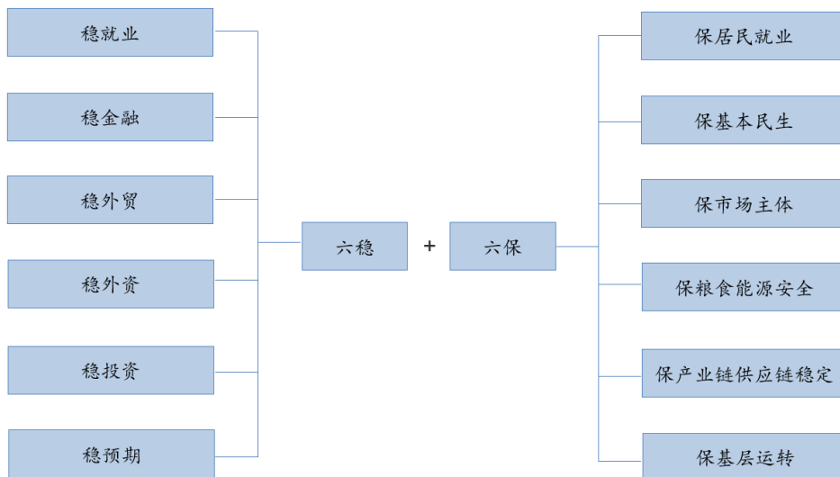
图 1：“六稳”工作和“六保”任务