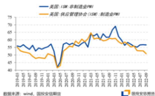
图：美国宏观景气度继续走低