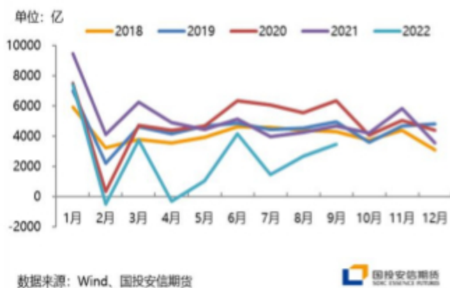
图：居民中长贷仍弱于历史同期