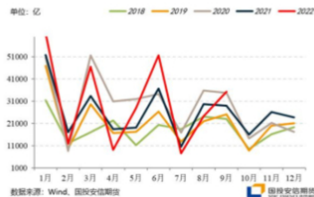
图：9月新增社融明显修复