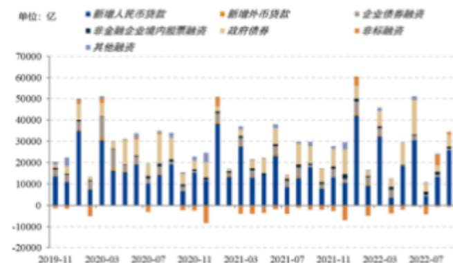
图：信贷大幅增长拉动新增社融