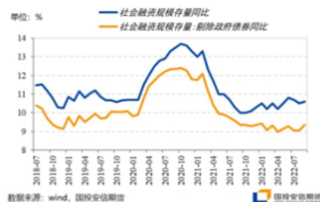
图：政府债券不再成为拉动社融存量的力量