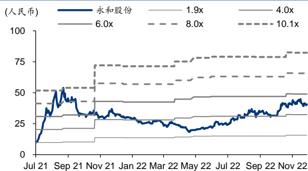
图表3: 永和股份 PB-Bands