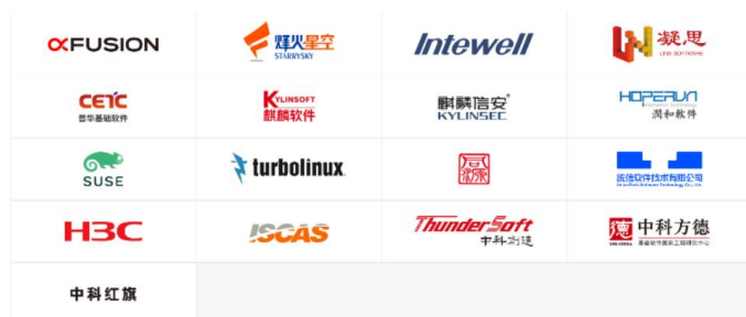
图 1：发布 openEuler 商业发行版的厂商

部操作系统厂商已经发布 openEuler 商用版本。数据库方面，华为开源了数据库 openGauss。2020 年 7 月 1 日，华为宣布开放 openGauss 数据库源代码，并成立 openGauss 开源社区。openGauss 基于开源数据库，关键内核代码自研，代码自主率高达 80%，不受美国 EAR（出口管制条例）管制，是国内少数具备极限生存能力的数据库产品。