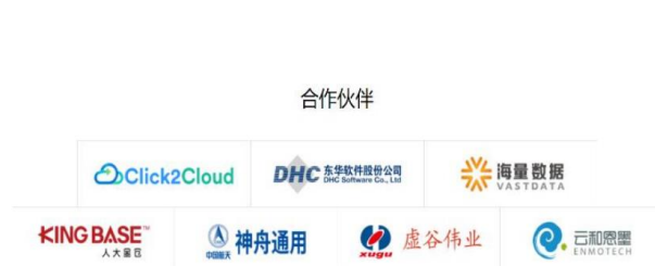
图 2：openGauss 合作伙伴