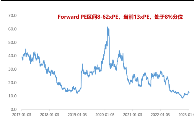
图 1：三七互娱 PE 处于 8% 的历史分位