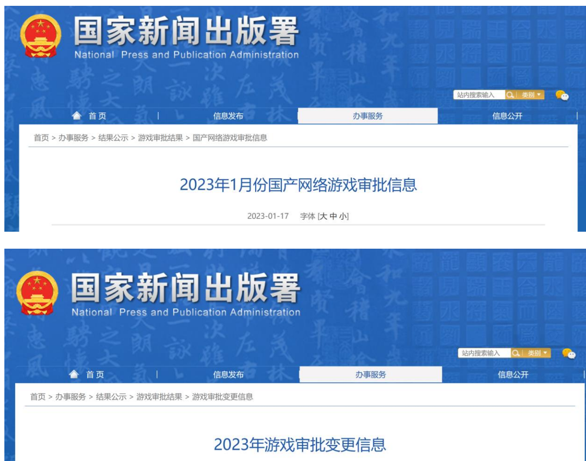
图1：2023年1月17日，国家新闻出版署公示2023年1月份国产网络游戏及2023年游戏审批变更信息