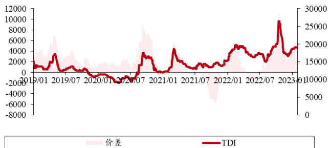
图表 6. TDI 价差（单位：元/吨）