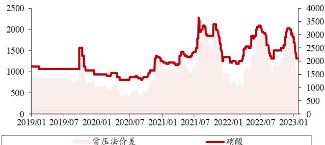
图表 5. 硝酸价差（单位：元/吨）