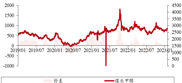
图表 4. 煤头甲醇价差（单位：元/吨）