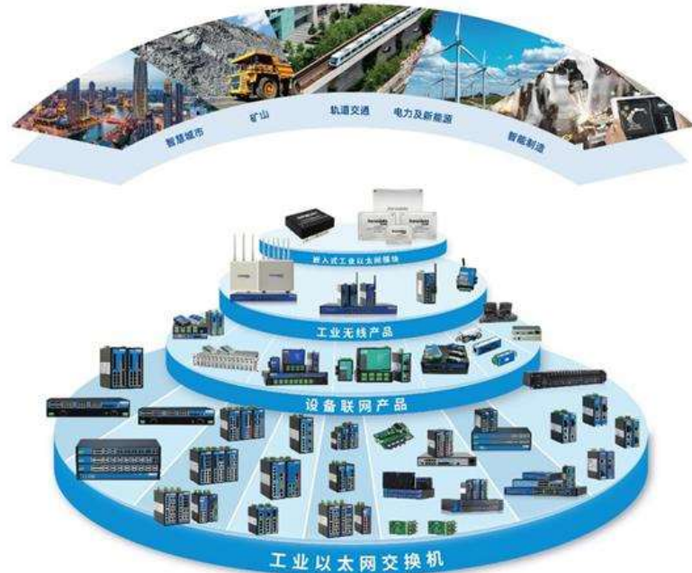
图 5: 三旺通信产品布局情况

深耕工业通信市场 20 余年, 产品体系齐全。公司为专注于工业互联网解决方案供应商, 坚持研发驱动和自主创新, 致力于工业互联网通信产品的研发、生产和销售, 主要产品包括工业以太网交换机、嵌入式工业以太网模块、设备联网产品、工业无线产品等四大产品线, 并可根据下游行业应用需求, 提供较为完善的定制化工业互联网通信系统整体解决方案。