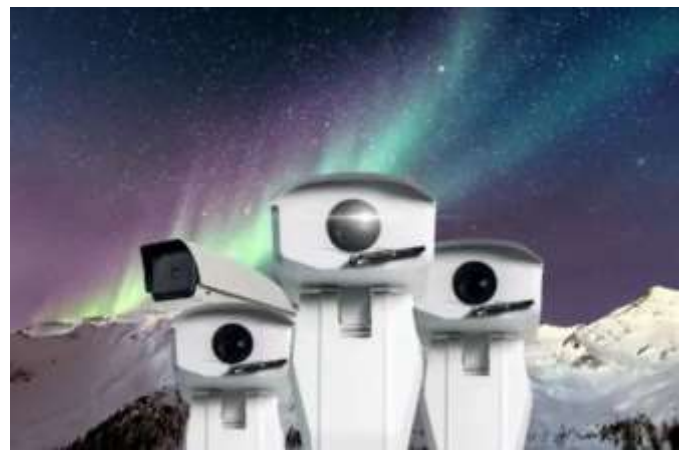
图 8：三旺通信极光夜视全彩摄像机