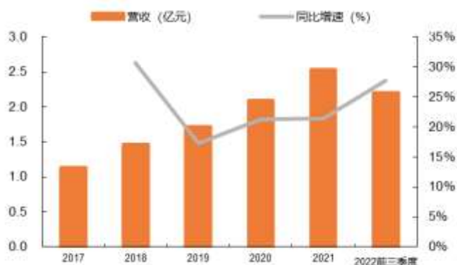
图 1: 2017-2022 年三旺通信营收及同比

工业互联网景气上行，在手订单持续增加。 公司订单充足且持续增加，营业收入较去年同期稳步增长。2022年，公司预计营业收入3.2-3.5亿元，同比增长26.06%-37.88%。单四季度来看，预计营业收入1.00-1.30亿元，同比21.95%-58.54%，环比12.36%-46.07%。我们认为，随着公司所处工业互联网行业快速发展，电力及新能源、智慧矿山、智能制造等终端应用市场需求强劲提升，以及公司订单开拓能力和市场竞争力进一步增强，我们预计公司业务将持续稳步增长。