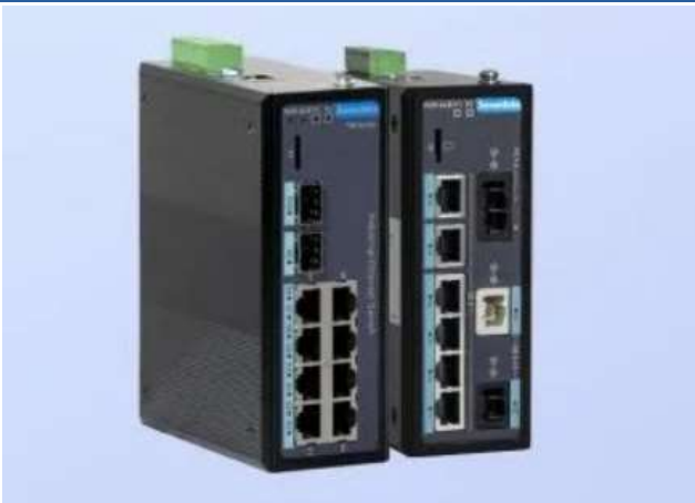
图 7：三旺通信 TSN 交换机新品

坚持研发驱动，持续加大研发投入。 2021年，公司研发投入超5,357.95万元，同比增长45.69%。2022年，公司持续发力技术研发，牵头编制了TSN解决方案白皮书并推出TSN交换机新品；发布极光夜视全彩摄像机，从源头突破传统夜视成像硬件技术极限，为各行业数字化转型塑造发展优势；推出的HaaS工业互联网互通平台能够实现异构系统的互联互通，助力工业资源复用以及迭代升级加速；与北大智能圈联合推出制造业“智改数传”AI智能贴标平台并成功运行。此外，公司设置了以技术创新与产品开发为导向的产品业务群，与客户业务群高度协作，推动“技术+市场”双轮驱动。