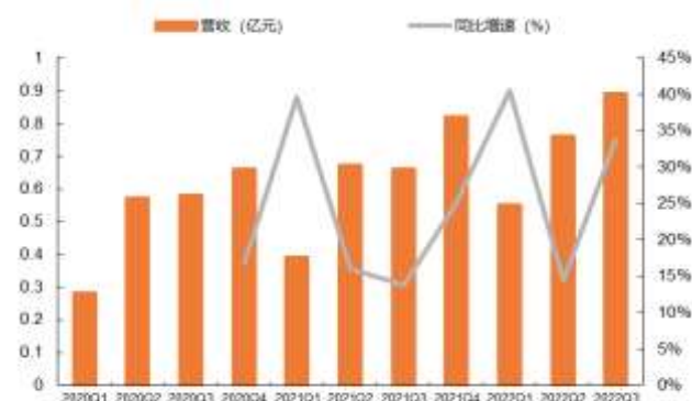
图 2: 2020Q1-2022Q3 三旺通信单季度营收及同比