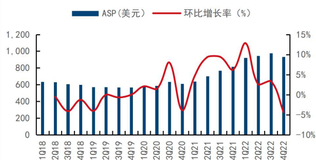
图4：公司季度 ASP（折合每片八寸晶圆）