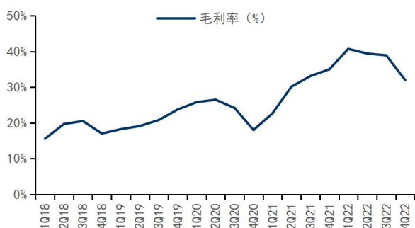
图3：公司季度毛利率