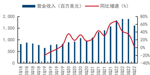
图1：公司季度营业收入及同比增速