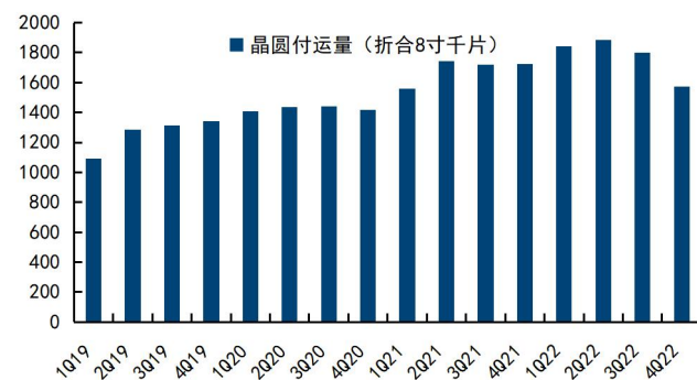
图6：公司季度晶圆付运量