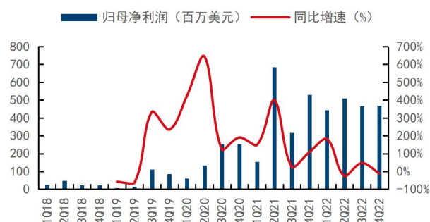
图2：公司季度归母净利润及同比增速