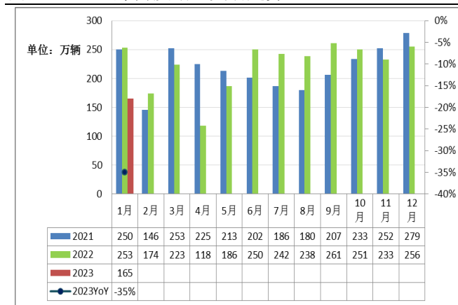
图表二：汽车月度销量变动趋势：