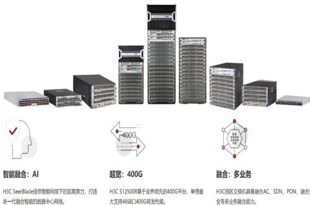
图 2：紫光股份 H3C S12500R 系列交换路由器

AI 高算力需求将促使数据中心交换机、路由器等网络设备迭代升级。各交换机厂商纷纷推出适合 HPC 服务器的更高交换容量、更高速的以太网端口的交换机系列，紫光股份推出的 H3C S12500R 系列数据中心旗舰融合交换路由器，支持高密 10GE/25GE/40GE/100GE/200GE/400GE 以太网端口；思科推出的 Nexus 9232E 和 Nexus 9800 系列交换机支持高密 400G 端口，作为向 800G 端口交换机迈进的过渡产品，充分满足数据中心应用及未来发展需求。