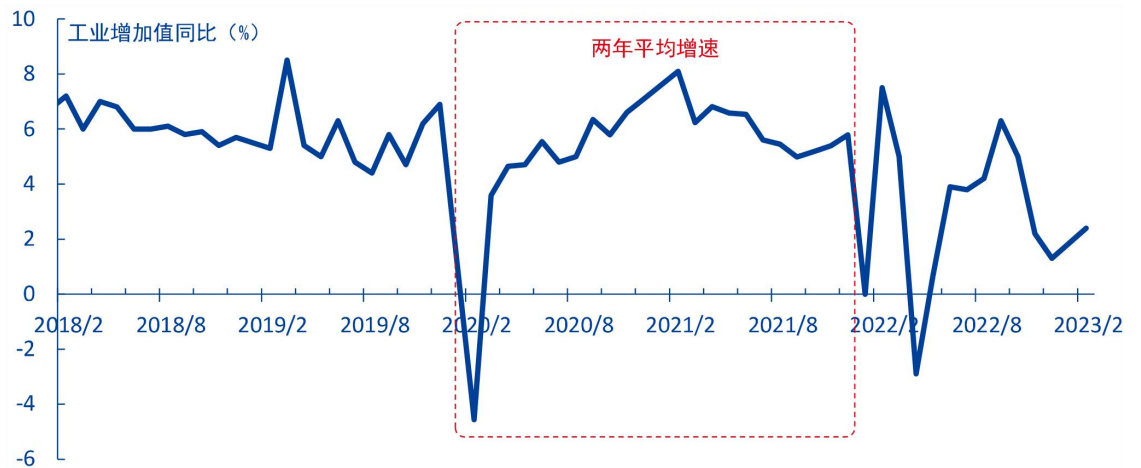
图 3: 工业增加值同比 (%)