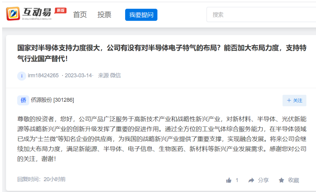
图1: 公司产品广泛服务于高新技术产业和战略性新兴产业