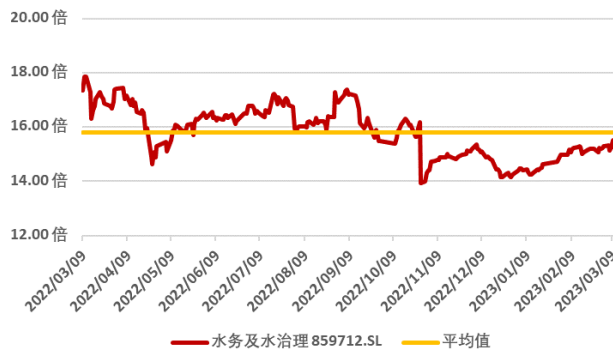
图 4：申万水务及水治理板块近一年市盈率水平（单位：倍）（截至 2023 年 3 月 17 日）