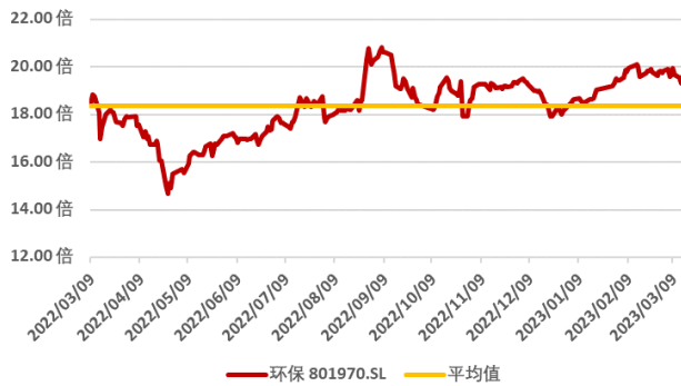
图 2：申万环保板块近一年市盈率水平（单位：倍）（截至 2023 年 3 月 17 日）