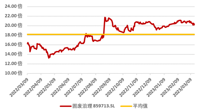
图 5：申万固废治理板块近一年市盈率水平（单位：倍）（截至 2023 年 3 月 17 日）