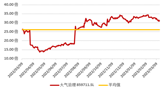
图 3：申万大气治理板块近一年市盈率水平（单位：倍）（截至 2023 年 3 月 17 日）