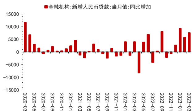
图 3：新增人民币贷款同比增加情况