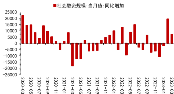
图 1：社会融资规模同比增加情况