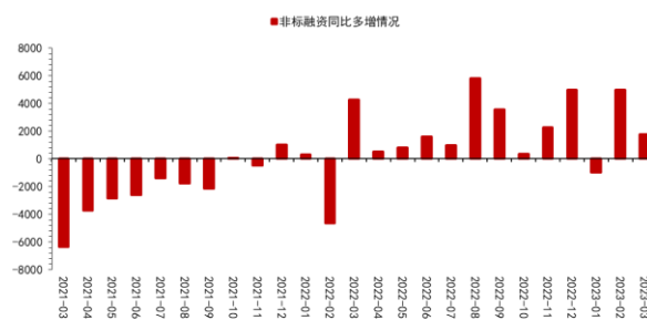
图 2：新增非标融资同比增加情况