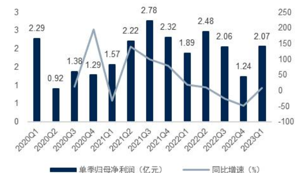
图4：2020Q1-2023Q1 国联证券单季归母净利润及增速