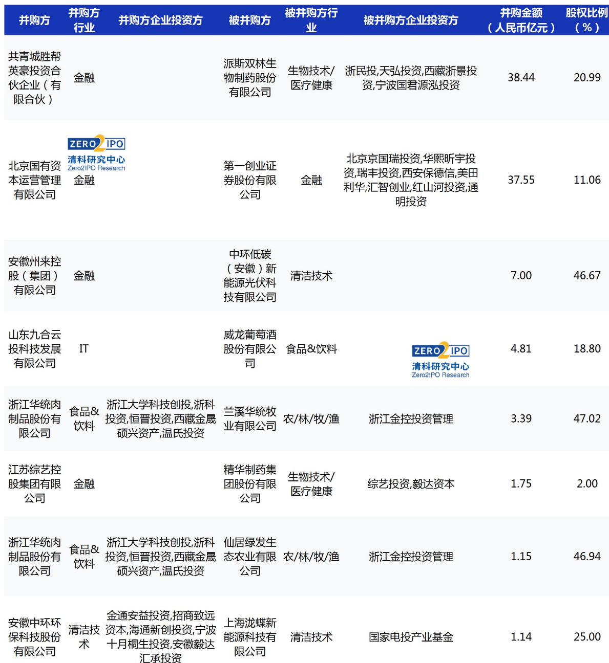
表 5 2023 年 5 月 VC/PE 支持并购部分案例