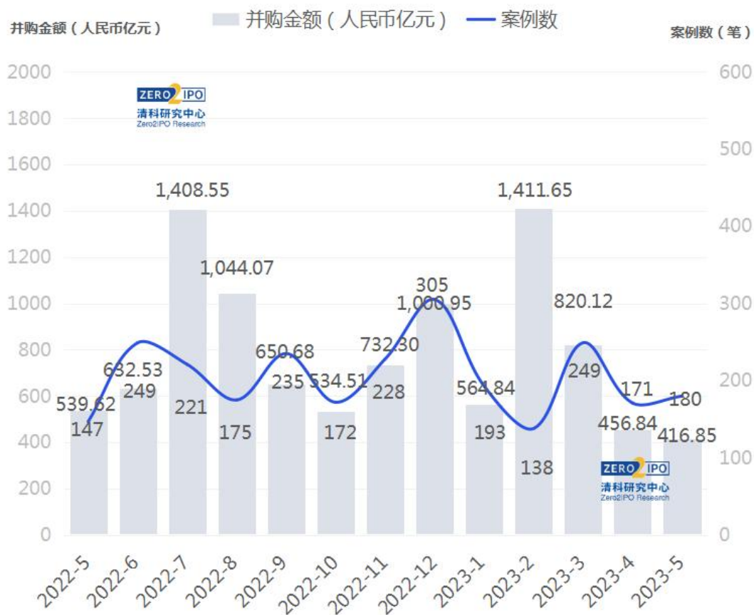
图 1 2022年5月至2023年5月并购市场交易趋势图

根据清科创业（01945.HK）旗下清科研究中心数据，2023年5月中国并购市场共完成180笔并购交易，数量环比上升5.3%，同比上升22.4%。其中披露金额的有130笔，交易总金额约为416.85亿人民币，环比下降8.8%，同比下降22.8%。