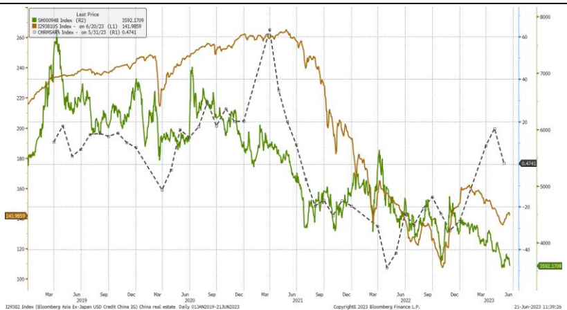
图表 2. 中国海外高收益债券指数（棕色线），CSI 中国内地房地产股票指数（绿色线）以及住宅销售同比增速（黑色虚线）