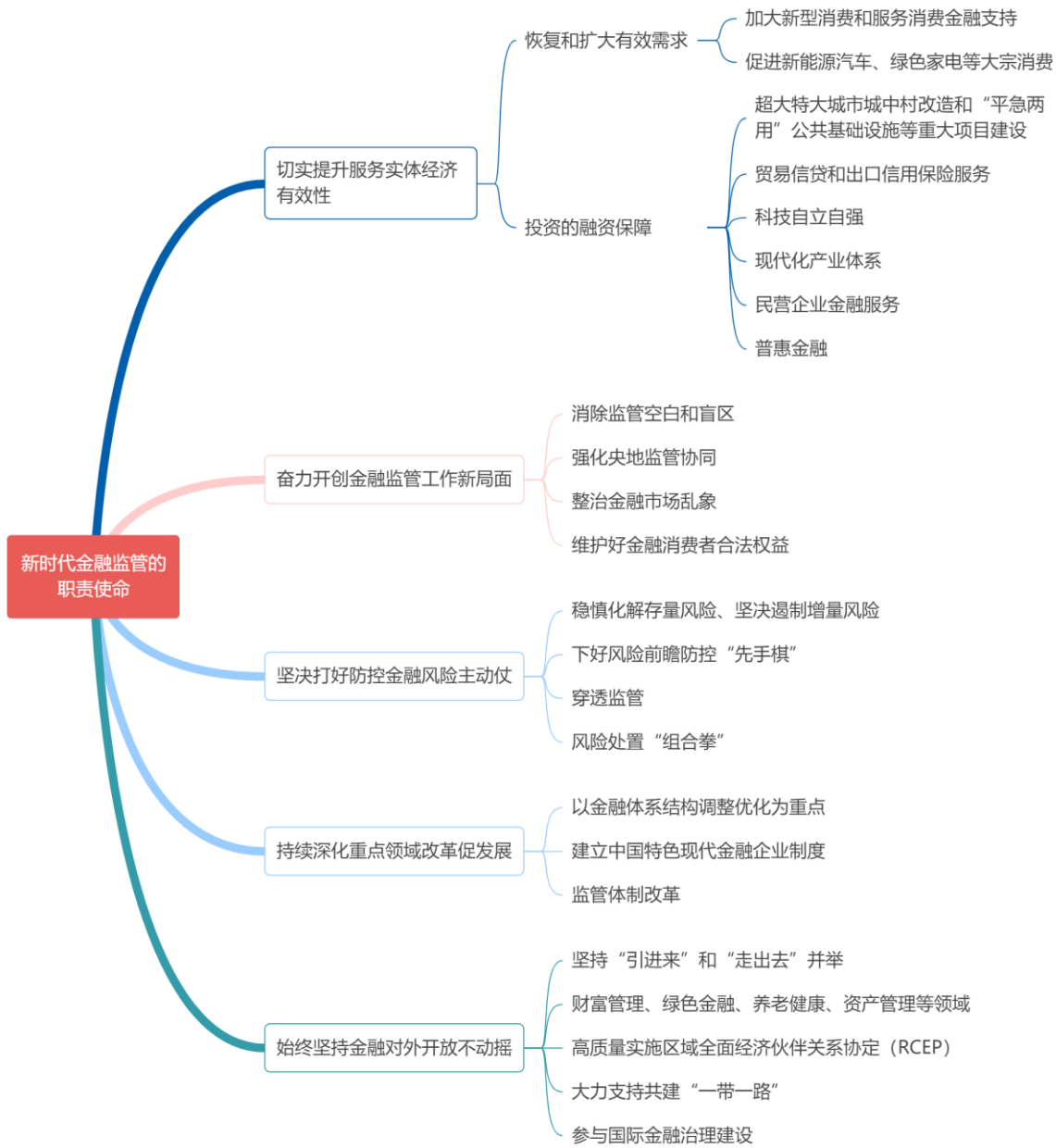
图 3：李云泽在第十四届陆家嘴论坛上的开幕辞及主题演讲梳理