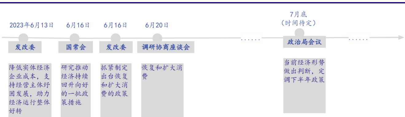
图 1：2023 年下半年政策及会议梳理

6月20日，“恢复和扩大消费”调研协商座谈会召开。会议就有关民主党派中央、全国工商联和无党派人士代表开展的相关调研成果进行协商。王沪宁出席会议并讲话。