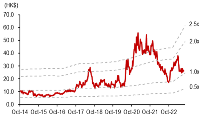
图表 9: 华虹半导体—12 月期静态 P/BV