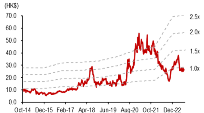
图表 7: 华虹半导体—12 月期动态 P/BV