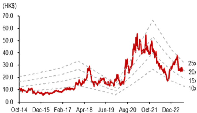
图表 6: 华虹半导体—12 月期动态 P/E