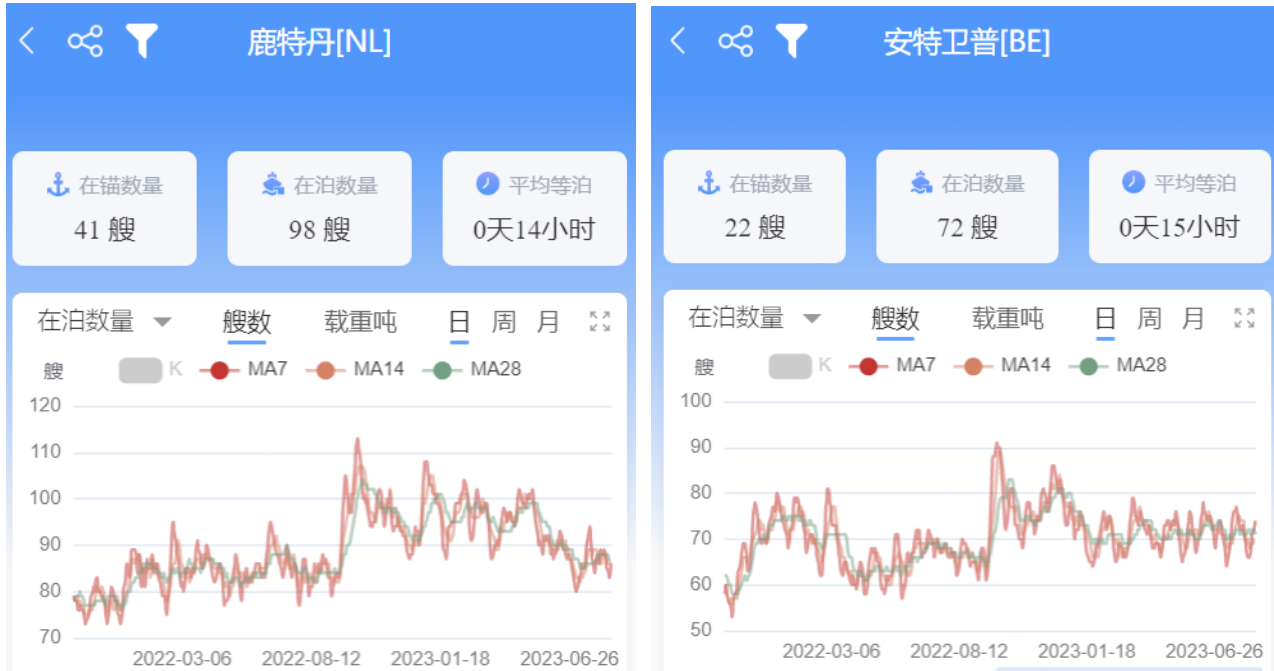
图 3-4：北欧基本港在港数量、在锚数量、在泊数量、平均等泊时间