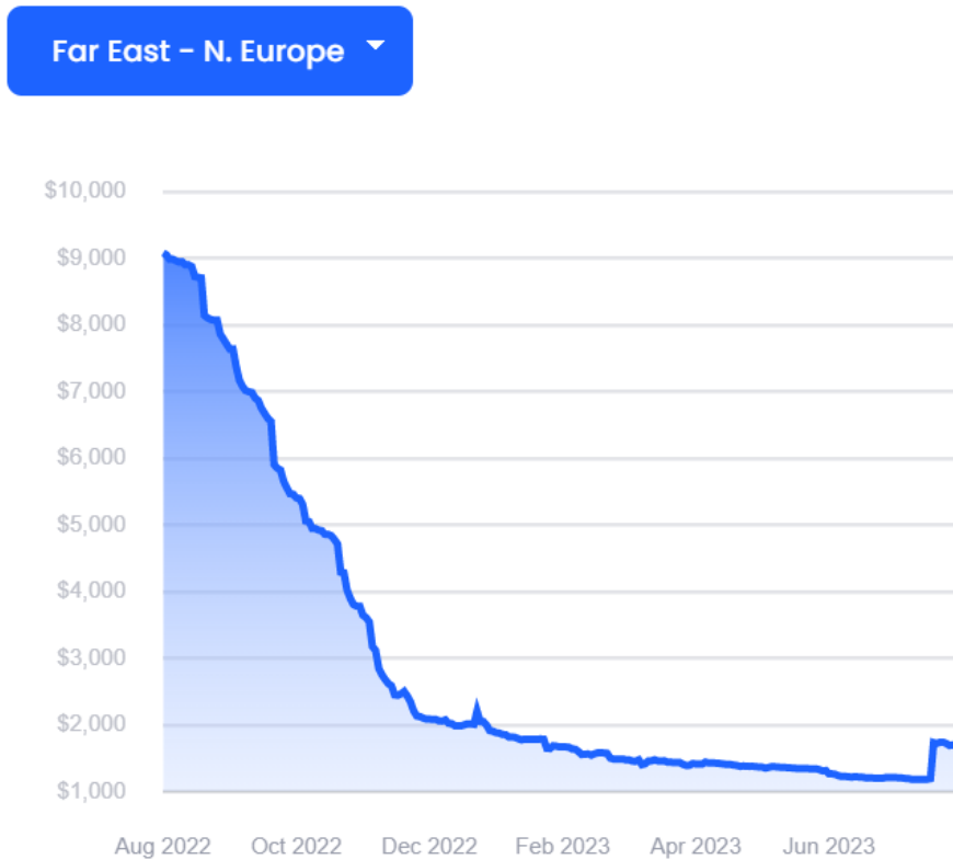
图 1-1：远东→北欧航线运价

根据 XSI-C 最新集装箱运价指数显示，8 月 11 日远东→欧洲航线录得$1684/FEU，较昨日下跌$1/FEU，日环比下跌 0.06%，周环比下跌 3.38%。