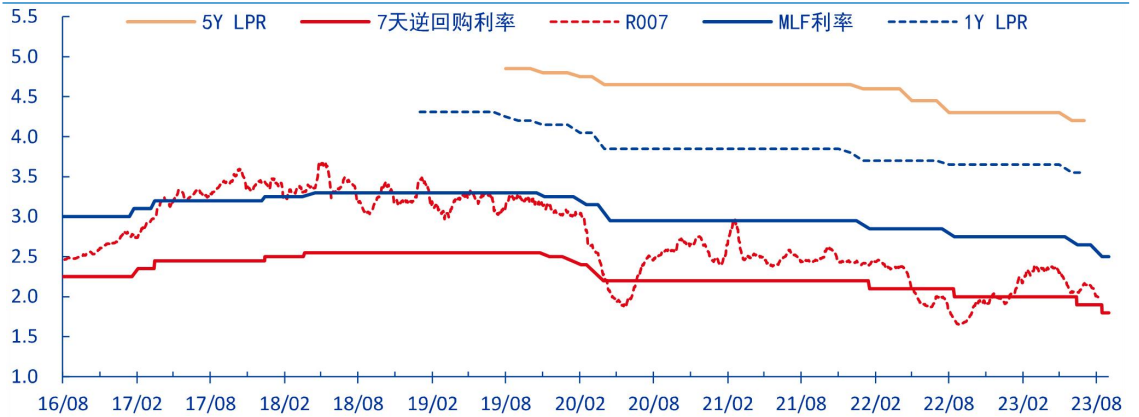
图 2: R007 及政策利率体系 (%)