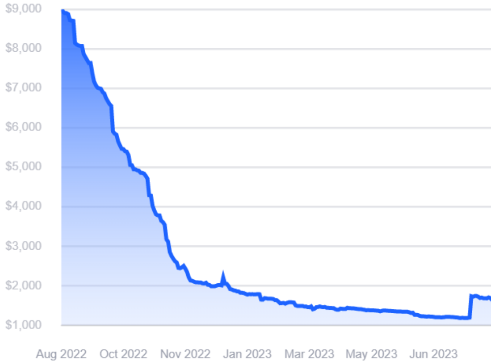
图 1-1：远东→北欧航线运价