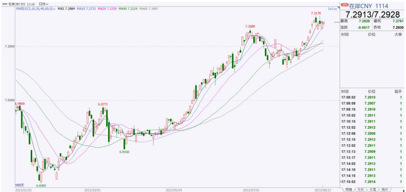
数据来源：同花顺期货、方正中期期货研究院整理