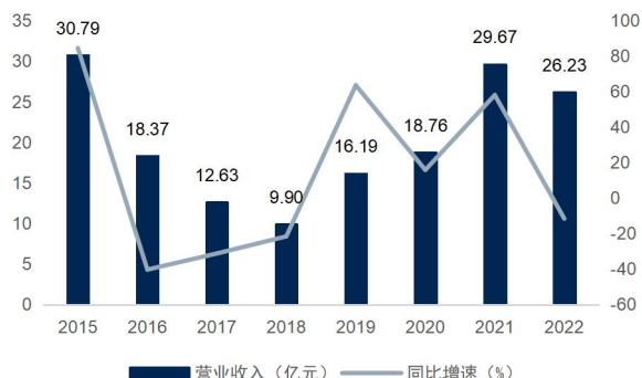
图1：公司营业收入及同比增速