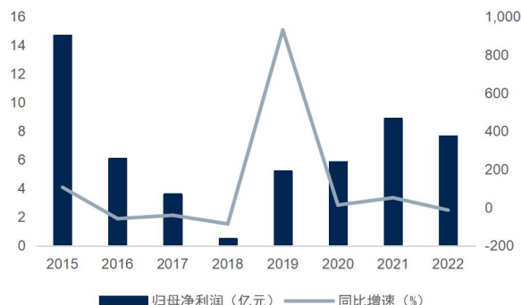
图2：公司归母净利润及同比增速