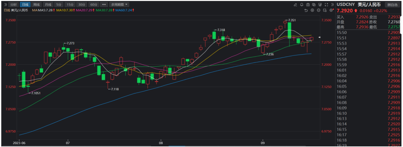
图 6-1：人民币兑美元汇率