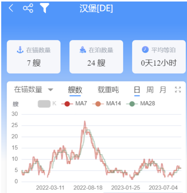
图 4-1：北欧基本港在港数量、在锚数量、在泊数量、平均等泊时间