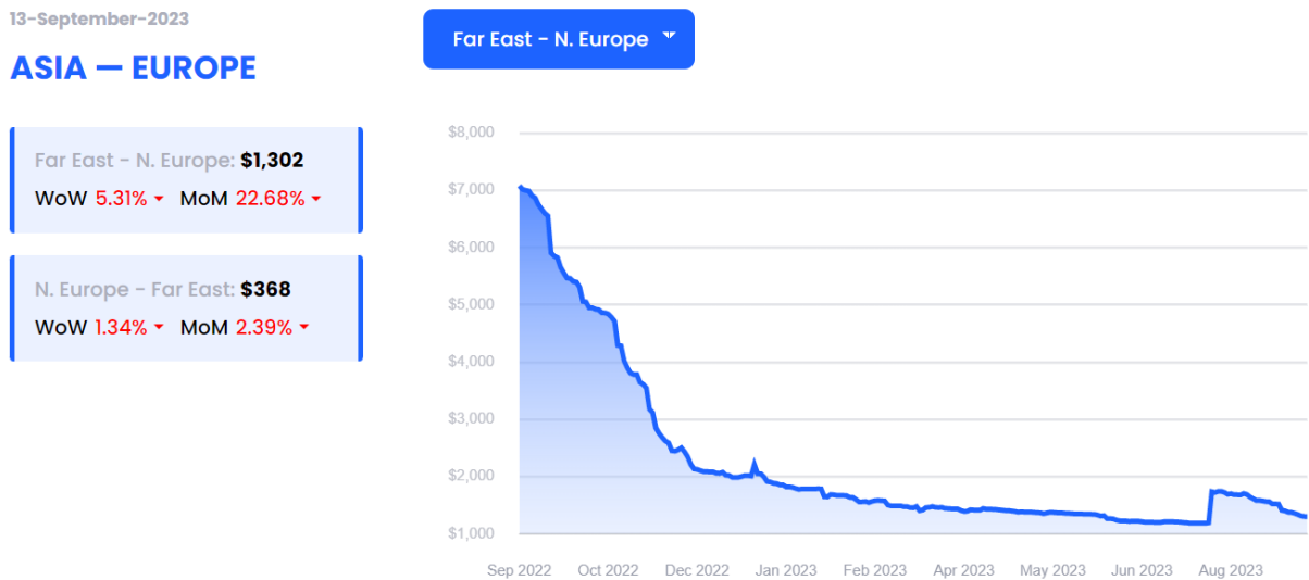
图 2-1：远东→北欧航线运价

根据 XSI-C 最新集装箱运价指数显示，9 月 13 日远东→欧洲航线录得$1302/FEU，日环比下跌 0.2%，周环比下跌 5.3%。