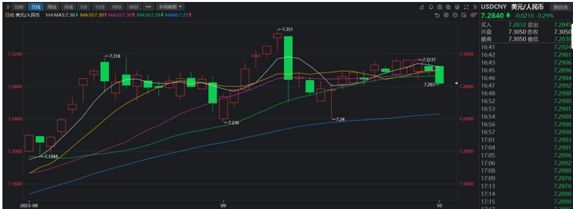
图 6-1：人民币兑美元汇率 数据来源：同花顺期货、方正中期期货研究院整理