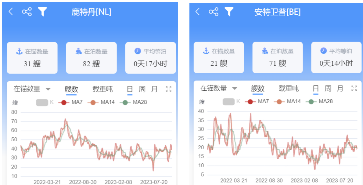
图 4-1: 北欧基本港在港数量、在锚数量、在泊数量、平均等泊时间