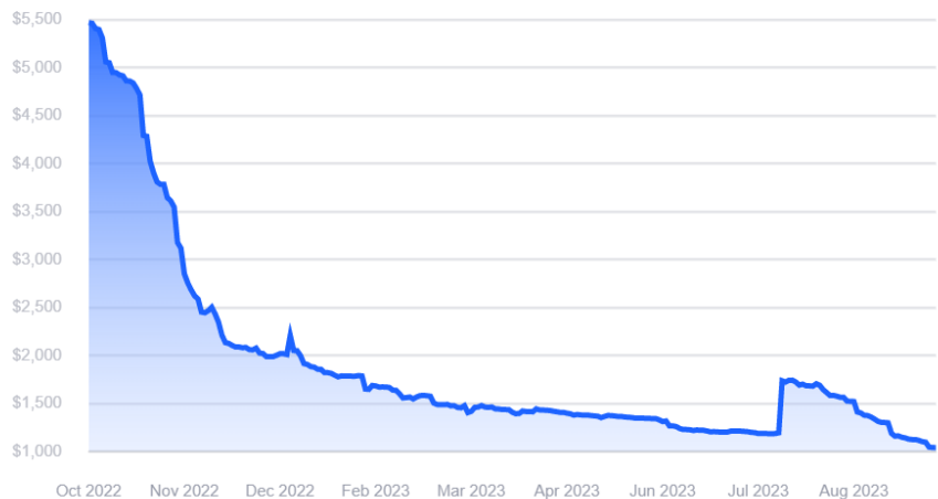
图 2-1：远东→北欧航线运价