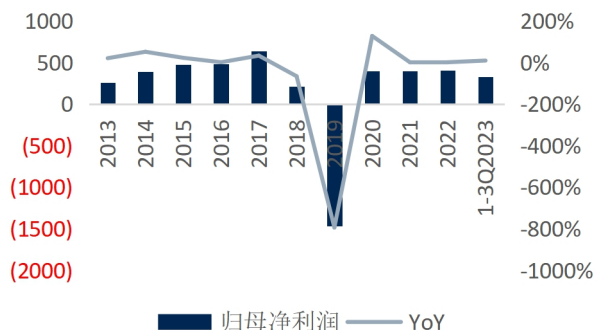
图3：华策影视归母净利润及增速（单位：百万元、%）