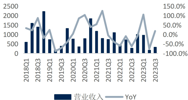
图2：华策影视单季营业收入及增速（单位：百万元、%）