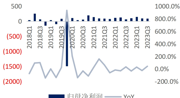
图4：华策影视单季归母净利润及增速（单位：百万元、%）