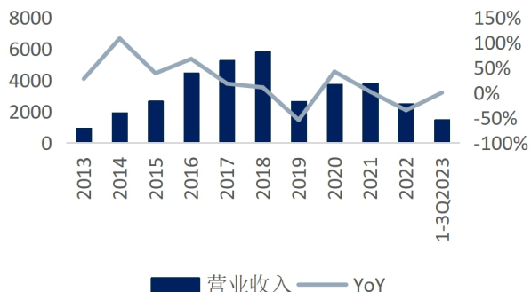
图1：华策影视营业收入及增速（单位：百万元、%）

Q3 业绩同比向上，盈利能力表现良好。 1) 公司披露 23 年 3 季报，前三季度公司实现营业收入 14.64 亿元、归母净利润 3.27 亿元，同比分别增长-0.02%、8.72%，对应全面摊薄 EPS 0.18 元；2) Q3 单季度公司实现营业收入 3.27 亿元、归母净利润 0.87 亿元，同比分别增长 17.96%、42.05%，对应全面摊薄 EPS 0.05 元；3) 前三季度公司毛利率达到 30.5%，继续保持在较高水平（21、22 年毛利率分别为 22.9%、33.7%）；净利率则达到 23.1%，处于近年来的较高水平；分季度来看，Q3 单季度毛利率、净利率分别为 39.0%、27.4%，继续保持较高水平。